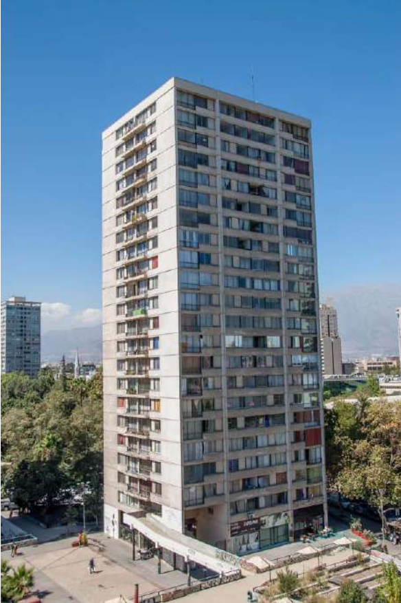
torre 4.