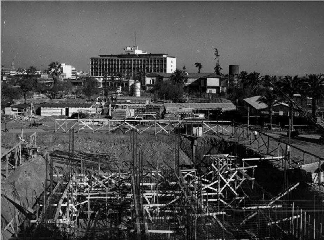
Cimientos de la Torre 13 de la Remodelación San Borja, al fondo la Posta.

habitacional, mediante una solución de viviendas sociales que integrara la vida de barrio con acceso a escuelas, centros de salud, áreas verdes y comercio.