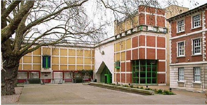
Pritzker 1981. James Stirling. Tate Gallery de Londres