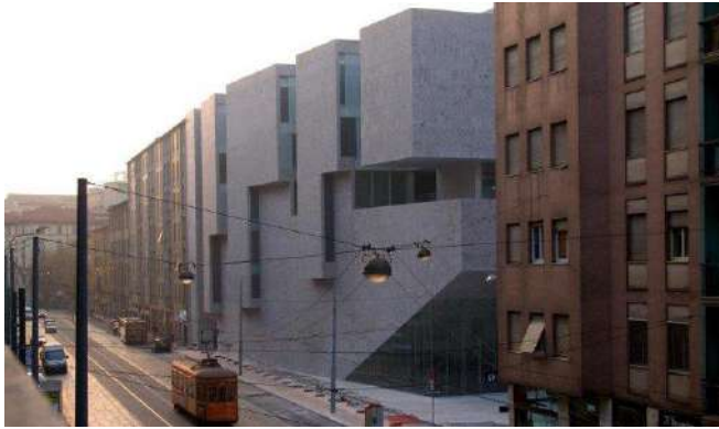
Pritzker 2020. Grafton Architects. Universidad Luigi Bocconi, en Milán.

-Nunca se revelan los nombres de los nominados, ni una “lista corta” de finalistas. Esto es por varias razones; alguien que no gana en un año, puede ser candidato después, y el jurado tiene que poder deliberar sin presiones ni interferencias. Revelar listas, podría dañar un proceso independiente, donde el jurado pueda debatir opiniones e ideas con franqueza, libertad, y sin preocupaciones de fugas de información.