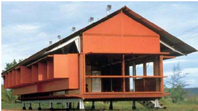
Pritzker 2002. Glenn Murcutt. Casa Marika-Alderton en Australia.

-El proceso de nominaciones al premio es un proceso muy abierto. Recopilo sugerencias de todo el mundo. Estas son en respuesta a solicitudes más y también nominaciones que me llegan de una forma más espontánea. Cualquier arquitecto del mundo puede enviar su sugerencia para el premio. El jurado de expertos con distintos puntos de vista y nacionalidades elige el ganador o ganadores cada año. El jurado puede tener entre cinco y nueve miembros según los estatutos del Premio. Actualmente hay 8 miembros del jurado de 7 países distintos. Incluye arquitectos profesionales, profesores, críticos y un juez que representa el lado público o de clientes, todos con una amplia cultura arquitectónica y gran conocimiento. El jurado selecciona el o los ganadores cada año. Ellos se representan sólo a sí mismos y no a ninguna institución, colectivo, o país. Los miembros del jurado participan tres años, como mínimo, lo que da continuidad y estabilidad al premio.