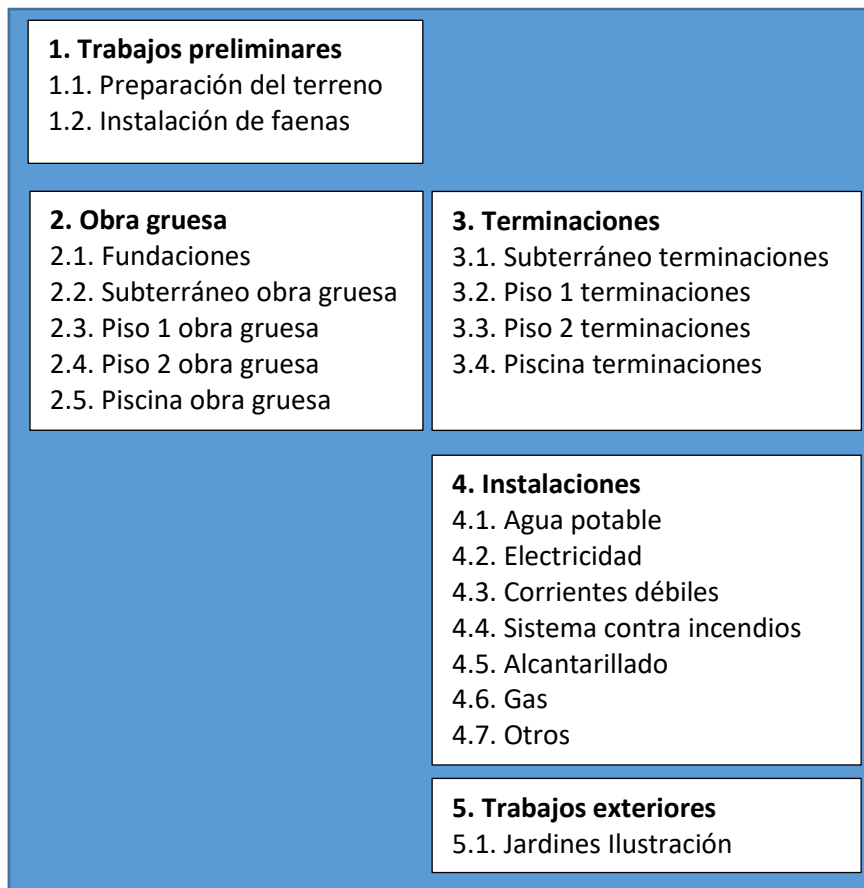
Diagrama 42. Basado en:

¿Cuánto tiempo tomaría realizar la construcción de “el sueño de la vivienda propia”? Para tener una idea hagamos el ejercicio de examinar el siguiente Diagrama. En él se describe la pauta de unas especificaciones tecno-constructivas de una supuesta casa habitación hecha en hormigón armado. Bajo supuestas condiciones óptimas de factibilidad, la ruta crítica no debiese exceder los 6 meses