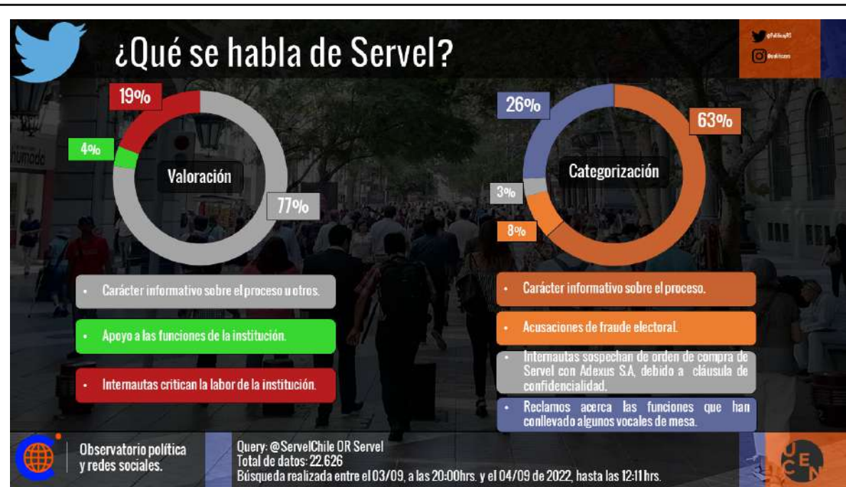
Imagen 9. ¿Qué se habla de Servel?