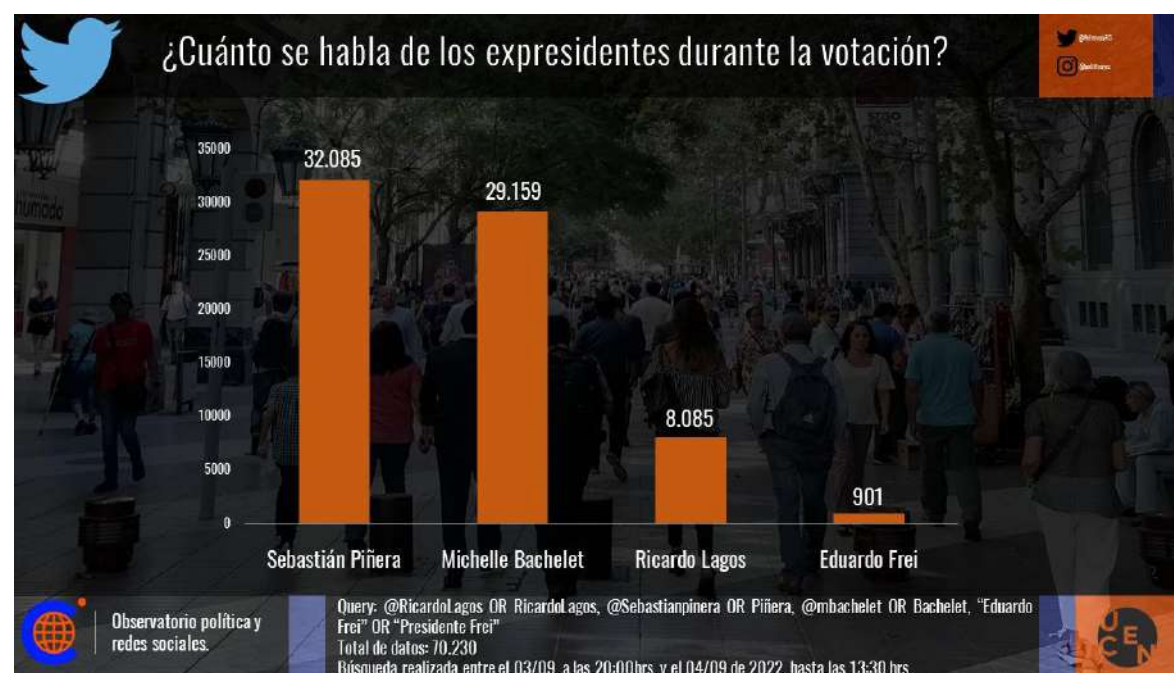
Imagen 3. ¿Cuánto se habla de los expresidentes durante la votación?