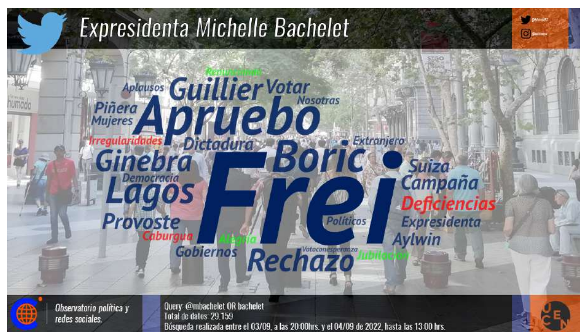
Imagen 4. Nube de palabras expresidenta Michelle Bachelet