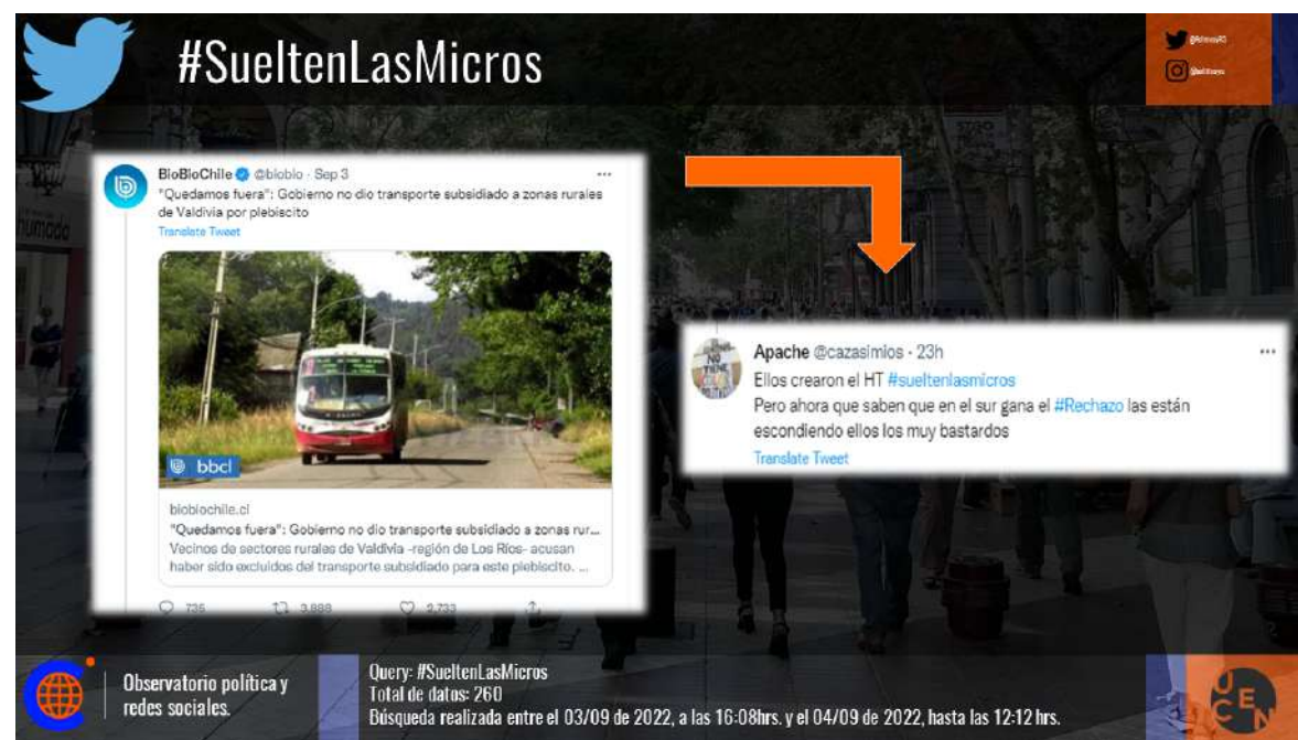
Imagen 2. Concepción de Hashtag #SueltenLasMicros.

Fuente: Elaboración propia en base a datos recolectados de Twitter.