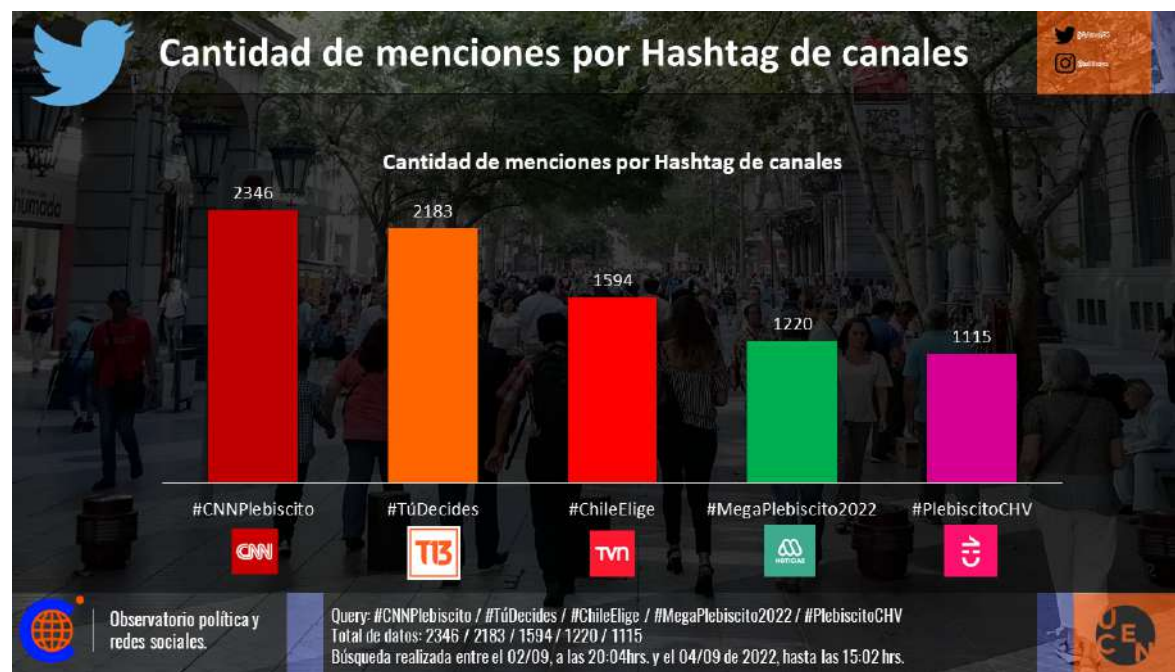
Imagen 1. Menciones de Prensa