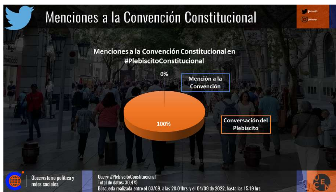
Imagen 3. Menciones a la Convención Constitucional en el Plebiscito