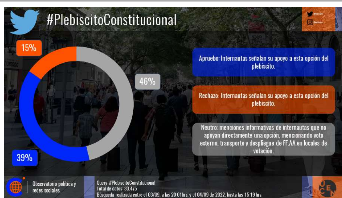
Imagen 1. Categorización entorno al #PlebiscitoConstitucional