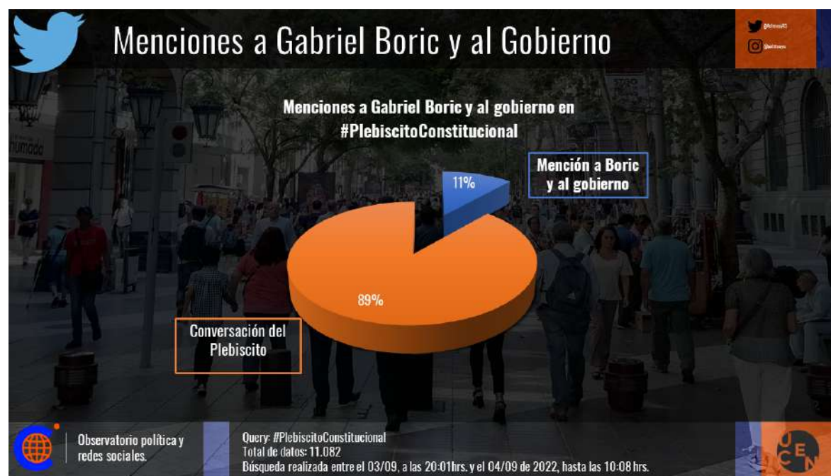
Imagen 2. Menciones a Gabriel Boric y al gobierno