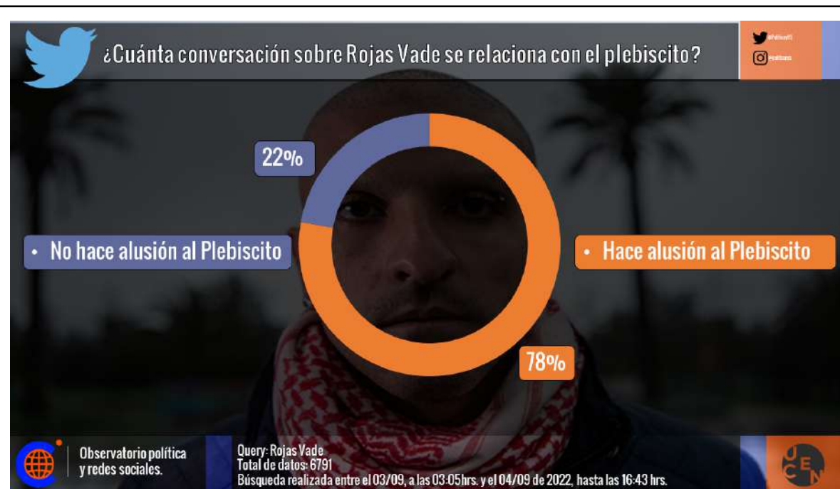
Imagen 5. Rojas Vade