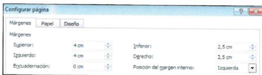
Fig. 3 Configuración márgenes en Word 2010