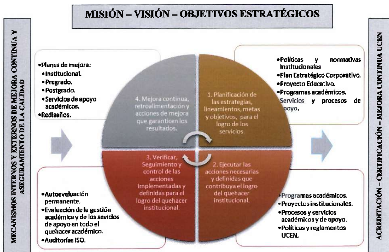
Figura 3: Ciclo de Calidad de la Universidad Central