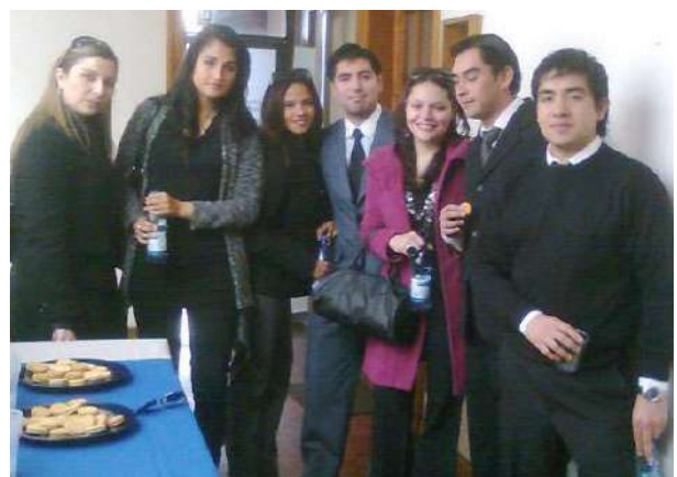
Estudiantes de la Clínica Jurídica en dependencias de la Subdirección de la Corporación de Asistencia Judicial de La Serena.