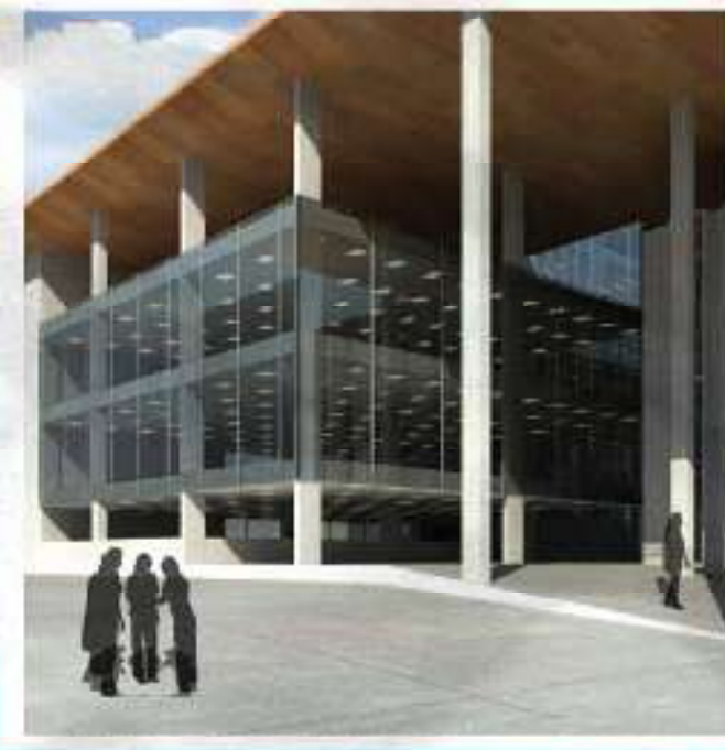
Imagen artística, Inauguración 2º semestre 2009.

OCREO en Z educación de Calidad sin una infraestructura que la soporte