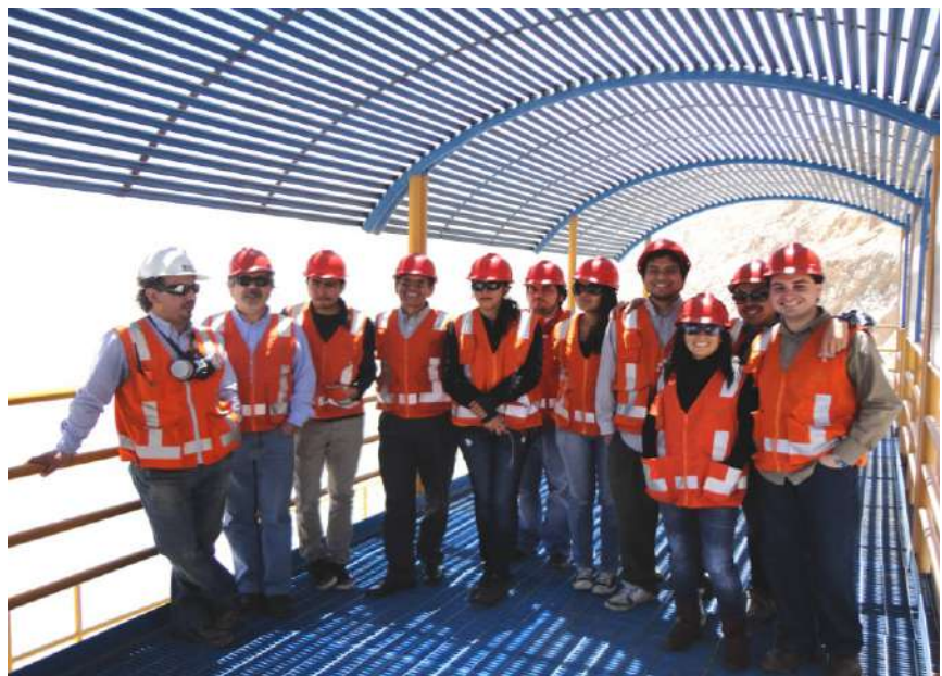
Los estudiantes de Sociología en el mirador de Chuquicamata

En la visita los estudiantes despejaron una serie de dudas e