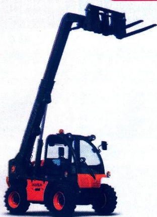
AUSA MANIPULADOR TELESCÓPICO T-144H DE 1350 KG DESDE 48.000 USD+IVA