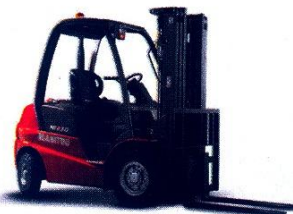
MANITOU GRÚA HORQUILLA MI 20G DE 2 TN DESDE 24.000 USD+IVA