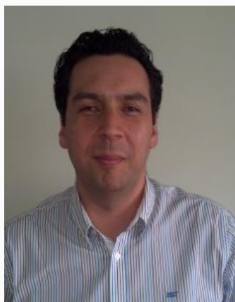
Cristian Index ANEXO: 6075