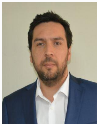
Cristian Index ANEXO: 6075