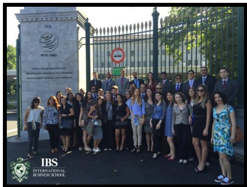
Visitas a Empresas