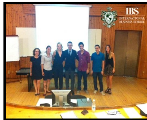
Presentación del Proyecto Final