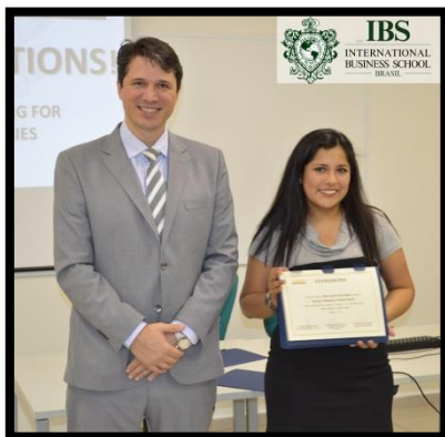
Ceremonia de Graduación