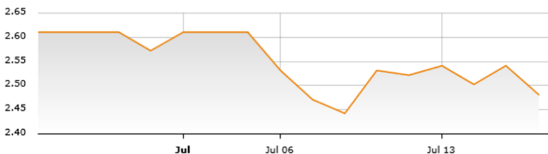
Gráfico del precio diario del Cobre el último mes

El cobre sufrió una caída de 1,7% respecto a la semana pasada. A pesar que los principales indicadores económicos de China superaron las expectativas de mercado y también se logró un acuerdo de ayuda financiera para Grecia, el precio del cobre mantuvo la tendencia a la baja, debido a la apreciación del dólar (1,92% respecto del viernes pasado). Luego que la presidenta de la FED, Janet Yellen, señaló ante la Comisión de la Banca del Senado que la primera alza de tasas de interés en casi una década probablemente ocurra este año, el dólar retomó la tendencia a la apreciación. En cuanto a China, la expansión del PIB del segundo trimestre se ubicó en 7, 0%, manteniendo el crecimiento respecto del trimestre previo, pero superando las expectativas que anticipaban un alza de 6,9% según encuesta de Reuters.