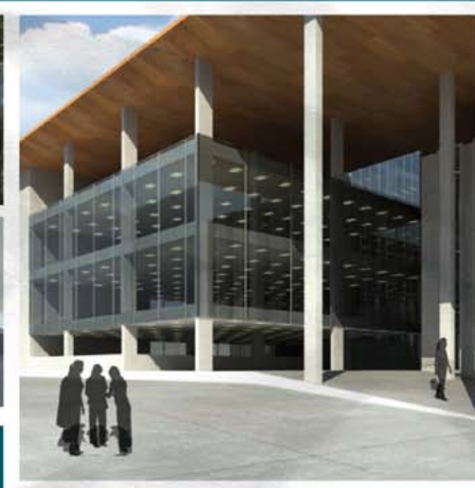
Nuevo edificio: Inauguración 2º semestre 2009.

OCREO en Z educación de Calidad sin una infraestructura que la soporte