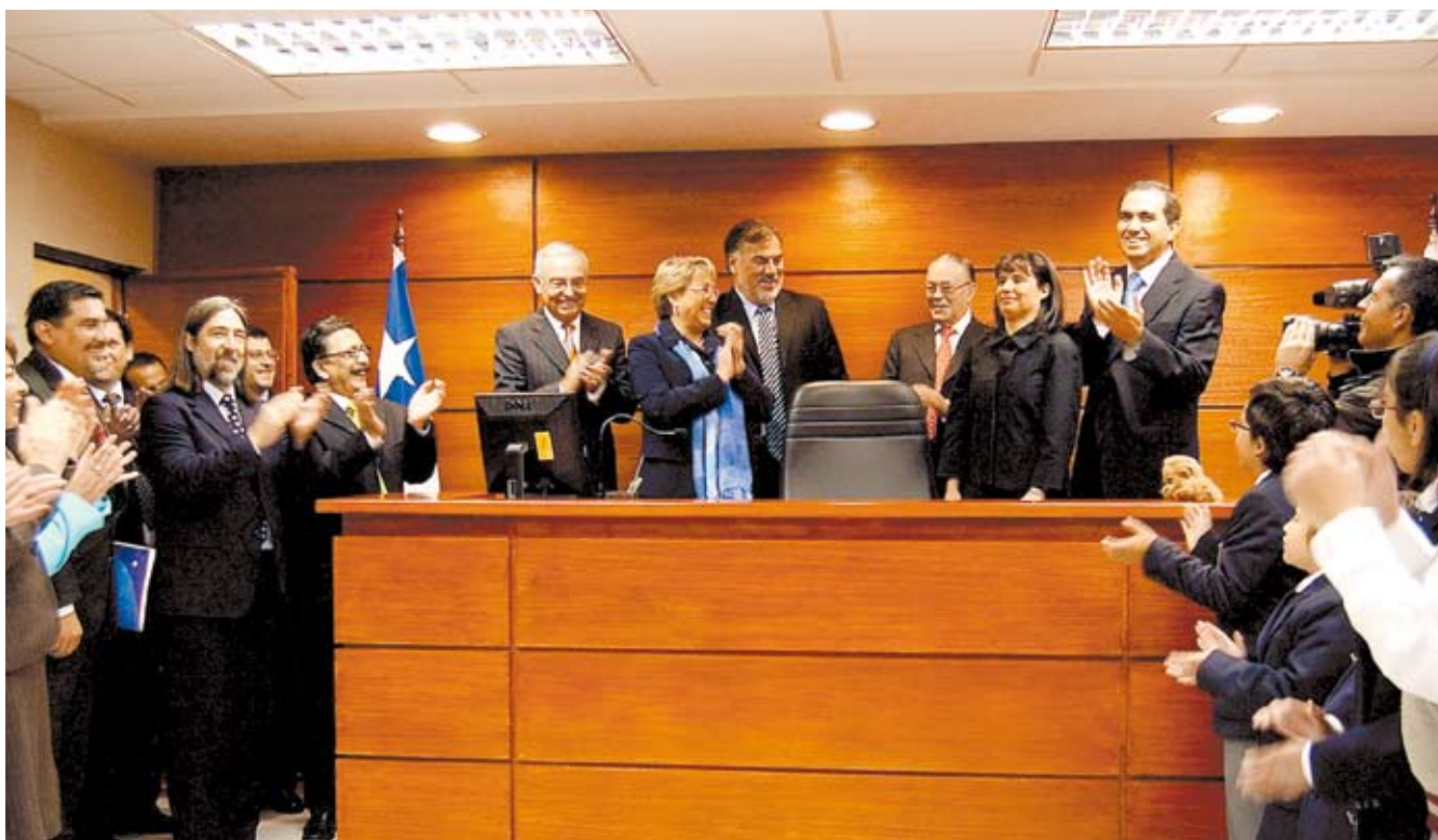
En una ceremonia junto al Presidente (s) de la Corte Suprema, Milton Juica; y los Ministros de Justicia, Carlos Maldonado y el ex titular del Trabajo, Osvaldo Andrade, la Presidenta de la República, Michelle Bachelet, destacó la partida gradual del nuevo sistema, como parte de las políticas sociales de su administración.

L a nueva Justicia Laboral pretende que los procesos sean más expeditos, mediante la agilización de los actuales juicios laborales –en el sistema antiguo una resolución de primera instancia puede tardar hasta 3 años–, la facilitación en el cobro de créditos laborales y previsionales, y brindar, al mismo tiempo, tutela efectiva a los derechos de los trabajadores (as).