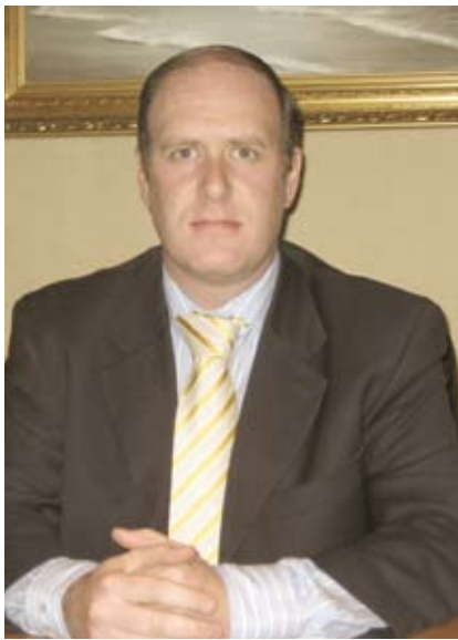
Por: Rafael Gómez Pinto, profesor de Derecho Comercial de la Facultad de Ciencias Jurídicas y Sociales de la Universidad Central.

“P ara comprender el verdadero sentido y alcance que ha de dársele al franquiciado o concesionario, es imprescindible distinguir su figura de la representación mercantil, de la agencia comercial, así como del corretaje de comercio, de la comisión, de la provisión y suministro, que tienden a confundirse.