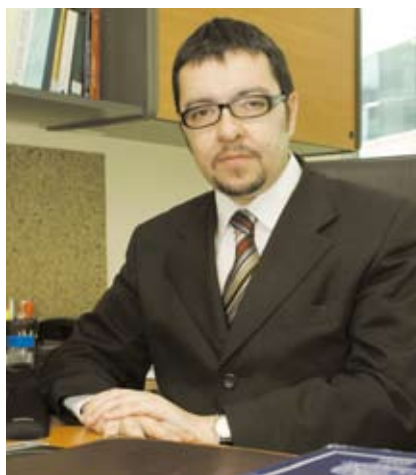
Por: Gonzalo Medina Schulz, Jefe de Estudios de la Defensoría Penal Pública.

Ambas etapas constituyen una preocupación de la Defensoría Penal, pues los riesgos para los derechos de las personas son evidentes en ambos momentos y, sin