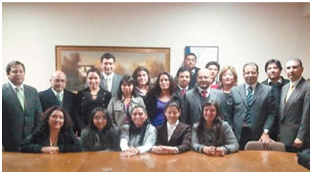
El Servicio Nacional del Adulto Mayor capacitó a estudiantes de la Clínica Jurídica y Forense de la UCEN.

El actual modelo de enseñanza clínica, considera necesario la incorporación temprana de los estudiantes a contextos de aprendizaje dinámicos, situados en campos reales o simulados relacionados con la práctica del rol profesional a desempeñar. De ahí que, a partir de fines de 2010, los talleres jurídicos pasan a ser coordinados técnicamente por el Departamento Clínico. Éstos, buscan la creación de condiciones para el desarrollo de los conocimientos, la información, las competencias, los talentos y las