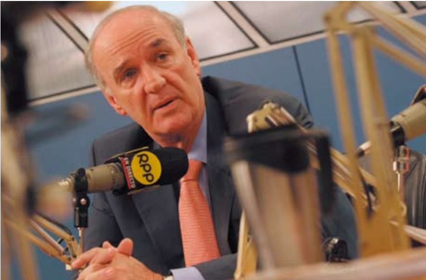
José Antonio García Belaunde, Ministro de Relaciones Exteriores de Perú.

presencia accidental de los barcos pesqueros peruanos, chilenos y ecuatorianos que traspasaran los límites), no es menos cierto que dos años antes, se había establecido el paralelo desde el punto en que interseca la frontera terrestre al mar. Así lo dice la Declaración de Santiago suscrita por tres países –Chile, Perú y Ecuador–.