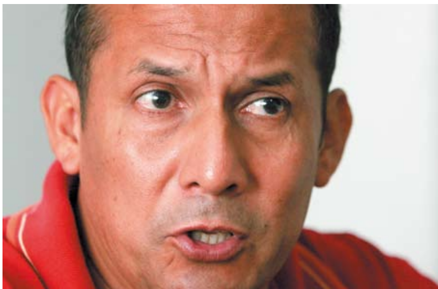
Ollanta Humala, Presidente de Perú.

Sí, por supuesto. En ese caso, el Derecho Internacional respalda plenamente los derechos chilenos. Hay un caso casi idéntico que se llevó ante la Corte y que corresponde a Tailandia y Cambodia, en que por un error de la comisión de límites francesa, una parte del territorio de Tailandia quedó en poder de Cambodia y, dentro de ese territorio, había un templo de gran valor ar-