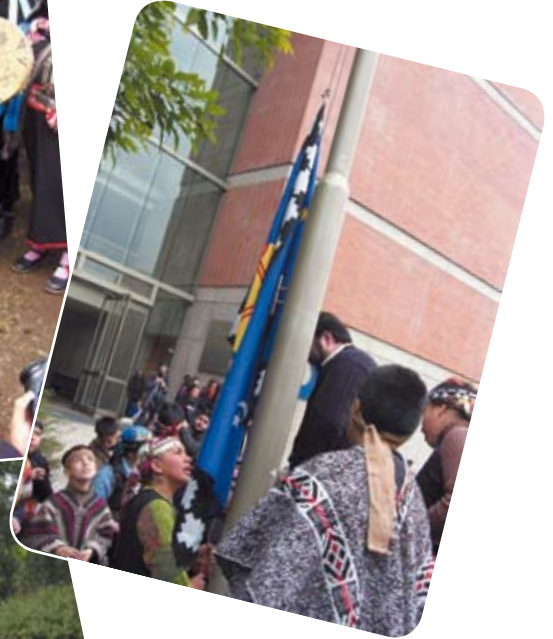
En la actividad se izó la bandera Mapuche.