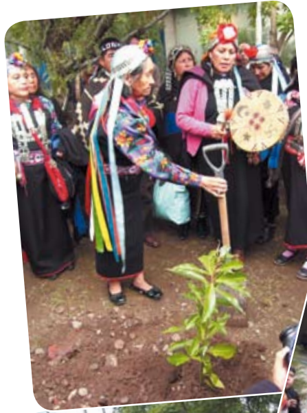
Plantación del canelo, árbol sagrado Mapuche que para la comunidad representa una conexión de espiritualidad con la cosmovisión.

Hay Mapuche que defienden más a su partido político que a su pueblo. A veces, es tan fuerte el poder del dinero que algunos Mapuche se han vendido al sistema, han traspasado los límites sin importar dañar a la comunidad. dn