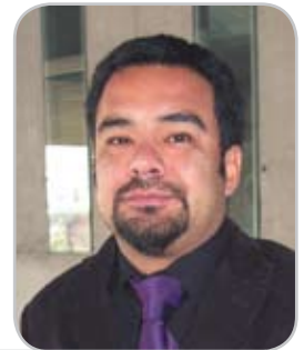
Por: Jorge Ulloa P. Secretario de estudios Facultad de Ciencias de la UCEN.

“La cuestión -más allá de la forma que se utilice- de la participación de la homosexualidad en su calidad de tal dentro de la constitución familiar es, en nuestro país y, pese a existir un par de proyectos de ley presentados en el Congreso Nacional, una discusión en ciernes. Discusión que radicada en el ámbito de lo político y lo moral, a su vez se puede reconocer cruzada por prejuicios, desinformación y desconfianza, tanto desde el lado heterosexual como desde el lado homosexual.