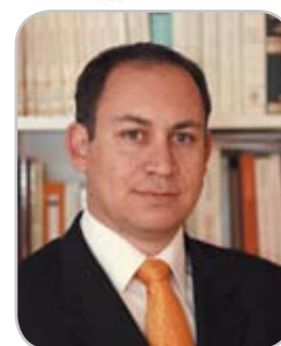
Por: Carlos Reusser. Académico de la Facultad de Ciencias Jurídicas y Sociales de la Universidad Central de Chile.

“El Consejo para la Transparencia ha comunicado al Servicio Electoral (SERVEL) que en aras de la transparencia no puede seguir vendiendo datos personales, sino que debe entregarlos gratuitamente a quién se los solicite.