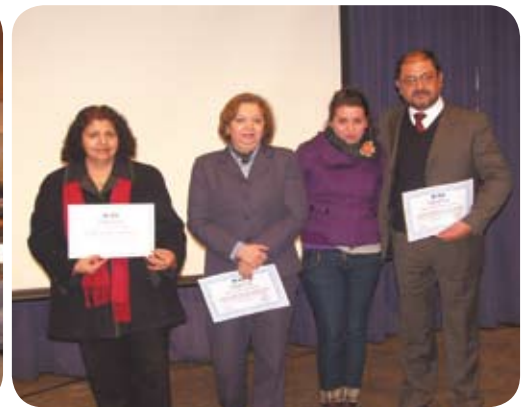
Ceremonia de clausura de la Escuela Sindical

-¿Por qué al Departamento de Derecho Económico y del Trabajo y a los alumnos les interesó hacer una Escuela Sindical este 2010?