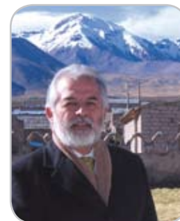
Por: Arturo Zegarra, Defensor Regional de Tarapacá.

“Una pregunta que vale la pena hacer es, si la diversidad étnica debe ser considerada como condición de excepcionalidad a las normas jurídico-penales que rigen en un Estado nacional y democrático como el de Chile. El problema que se plantea, es actual, pero no nuevo.