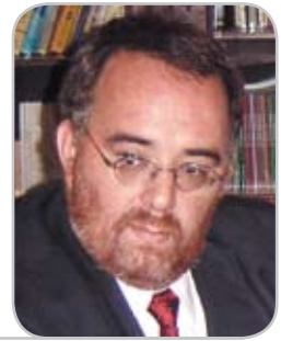
Leonardo Moreno. Defensor Regional Metropolitano Norte.