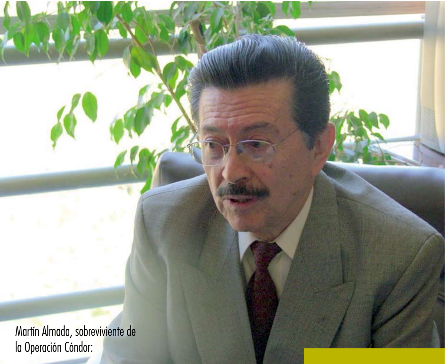
Martín Almada, sobreviviente de la Operación Cóndor: