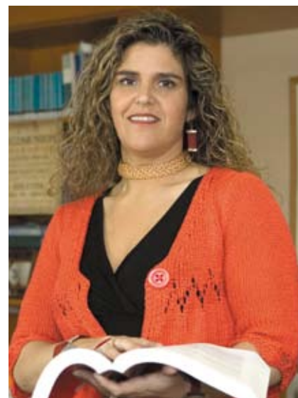
Paula Vial Reynal, Defensora Nacional.

Otro factor es el abuso de la prisión preventiva y especialmente el de la internación provisoria en el caso de los jóvenes. El uso excesivo de la privación de libertad para adolescentes como una forma de intimidación, de aplicación de pena anticipada debe ser corregido. No sólo atenta contra los principios del sistema de justicia en general, sino especialmente contra los del sistema de justicia adolescente. Utilizar el recurso a la internación provisoria con